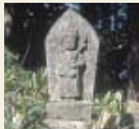
21番 六太寺 本尊等身聖観音