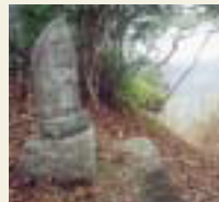
28番 成相寺 本尊聖観音