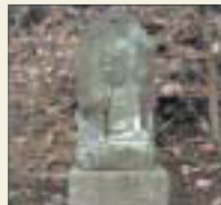
27番 書寫山 如意輪観音