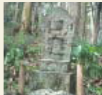
22番 總持寺 千手千眼観音