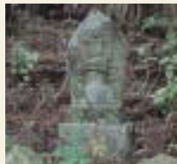
19番 革堂 千手観音