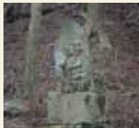
18番 六角堂 如意輪観音