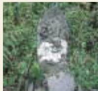
29番 松尾寺 馬頭観音