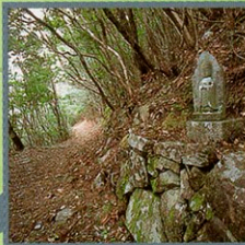
三十三観音像に見守られながら歩く