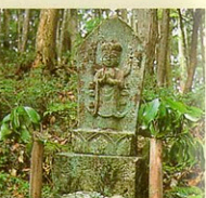
22番 總持寺(そうじ) 千手千眼観音