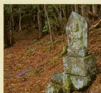
13番 石山寺 如意輪観音