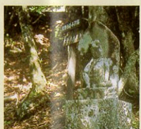
14番 三井寺(みいでら) 如意輪観音