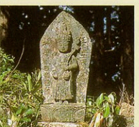
21番 穴太寺(あなおし) 本尊等身聖観音