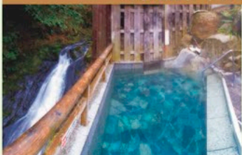
湯泉地温泉（「道の駅十津川郷」周辺）